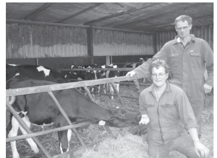
“Preventie kun je plannen”

Ja, als we niet vaccineren komt die pinkengriepuitbraak vroeg of laat absoluut langs.