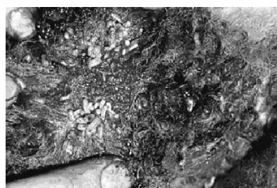
Maden onder de wol...