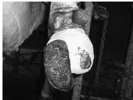
Een deel van de klauw geamputeerd door teenpuntnecrose