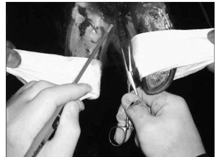
Het verwijderen van een tyloom