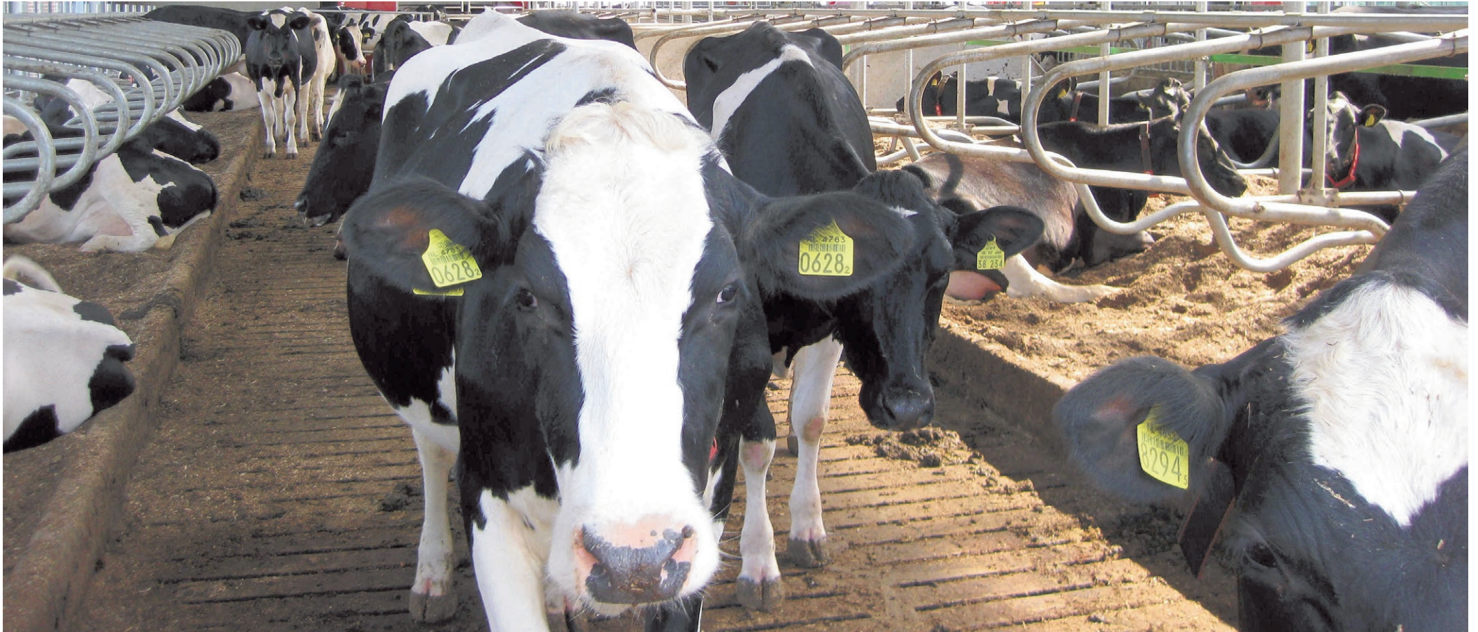
Gezonde koeien, zoals op de foto, produceren beter, stelt dierenarts Erwin Hoogland. Hij verwacht dat de aanpak van zijn praktijk leidt tot een lagere antibioticagebruik.

Van Stad tot Wad dierenartsen wil verantwoord medicijngebruik